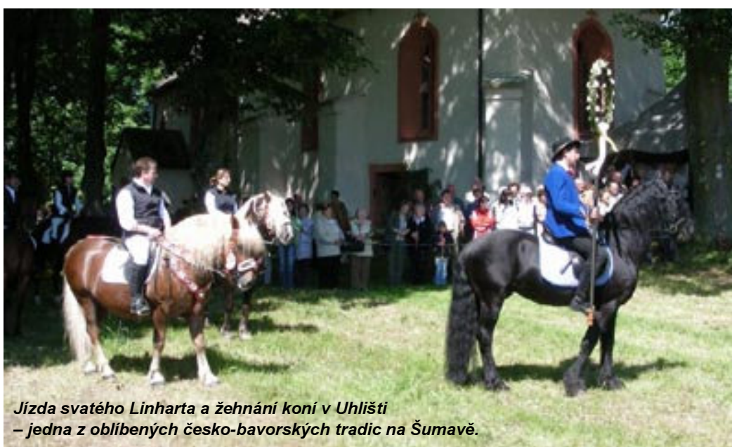
Jízda svatého Linharta a žehnání koní v Uhlišti – jedna z oblíbených česko-bavorských tradic na Šumavě.

koordinátor projektu „Integrovaný přeshraniční rozvoj Královského hvozdu“.