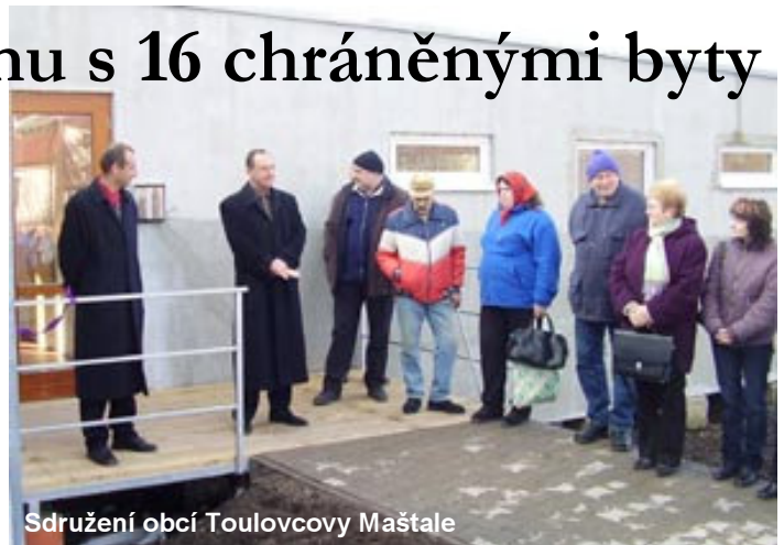
Sdružení obcí Toulcovy Maštale