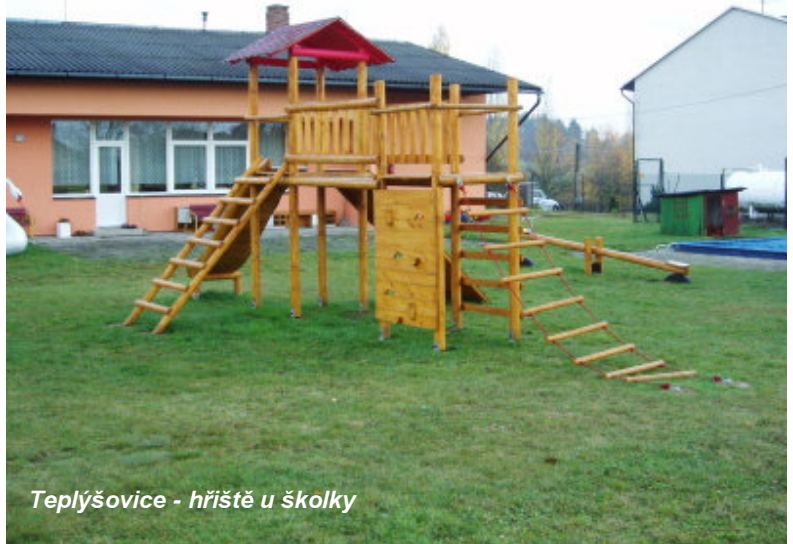
Teplýšovice - hřiště u školky