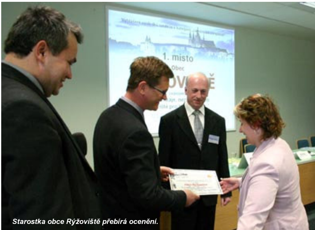
Starostka obce Rýžoviště přebírá ocenění.