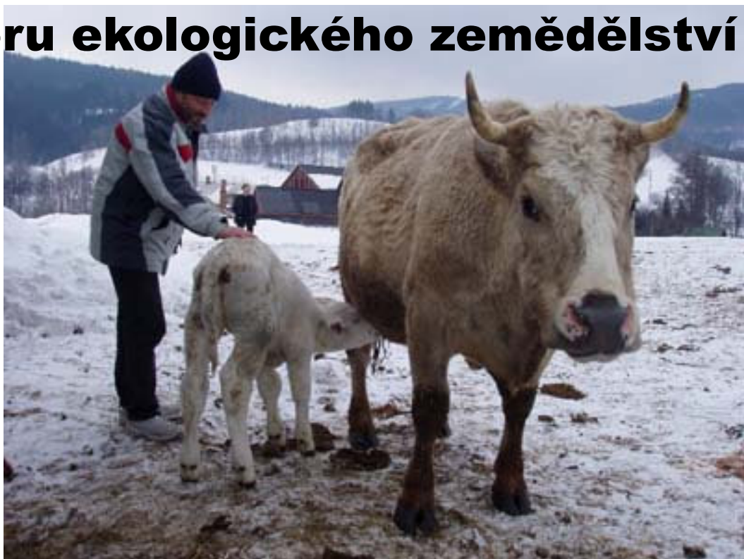
Na ekofarmě pana Strnada v Loučné nad Desnou

„Projekt zahrnuje celkem 38 různých aktivit ve čtyřech krajích: Kromě profesního vzdělávání se zaměří i na propagaci ekologického ze-